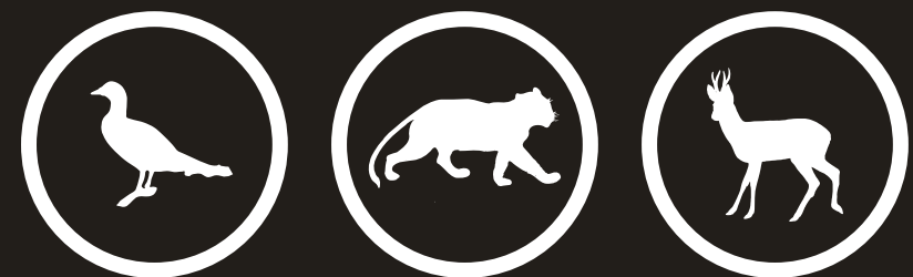
Pato de los torrentes / Torrent duck Puma / Cougar Huemul / South Andean deer