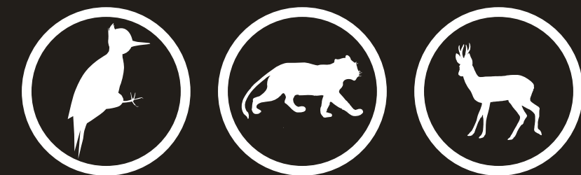
Pájaro Carpintero Woodpecker Puma Cougar Huemul South Andean deer

REPORTE EL AVISTAJE DE FAUNA EN EL CENTRO DE VISITANTES/ INFORMES